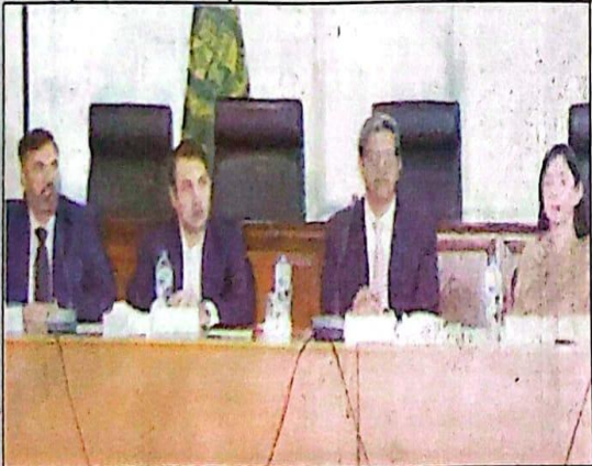
اسلام آباد، ورلڈ کمیشن ڈے کے موقع پر کشتاب میں شرکاء خطاب کر رہے ہیں