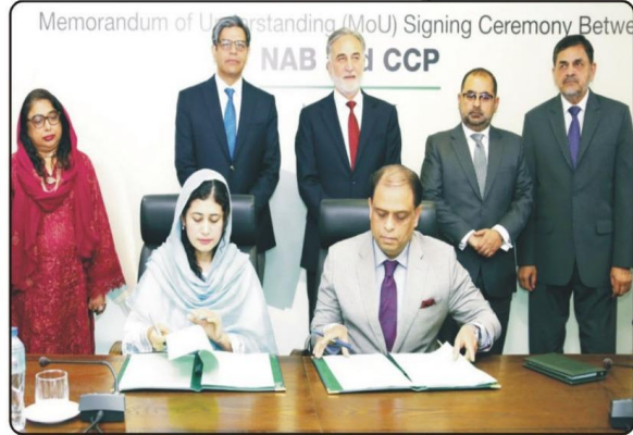
یکڑی سہایت کمیشن آف پاکستان میں آئی آر بی کے چیف ایگزیکٹو آفیسر اور دیگر اہلکاروں نے ایک ایف او ایم پر دستخط کر کے جی بی سی پی اینٹیلیجنس جنرل ڈیڑھ اور بی سی پی ڈائریکٹر ایگزیکٹو کی پیشکش کی۔

روزنامہ بزنس ٹائمز (3) جمعرات 15 مئی 2025ء