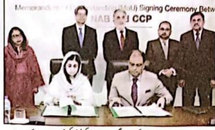
چیئر مین نیپ اور چیئر مین سی پی پی کی موجودگی میں نیپ اور کپٹین کیشن میں معاہدہ کیا جا رہا ہے