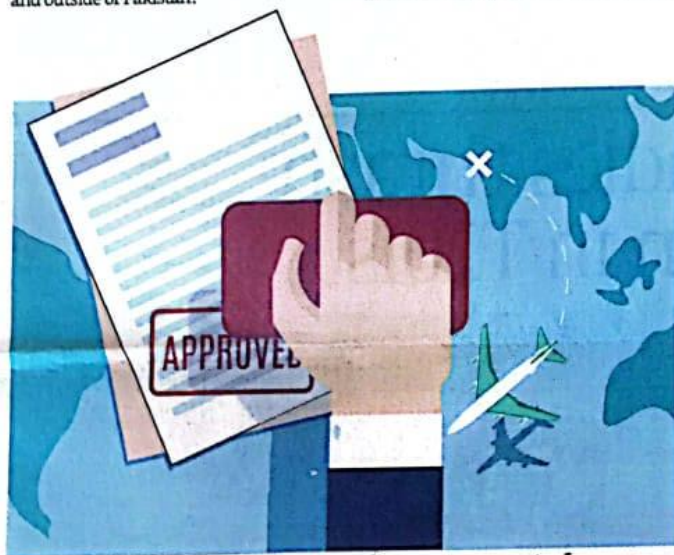
CCP approves Scheme of Arrangements for privatisation of PIA