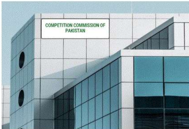
CCP aims to construct a STATE-OF-THE-ART HEADQUARTER in Islamabad

ISLAMABAD, 1 DECEMBER 2023: The Design Vetting Committee of the Capital Development Authority (CDA) has officially granted approval for the building plan of the Competition Commission of Pakistan (CCP). This development marks a new era in the progression of CCP.