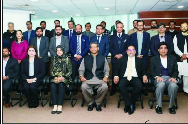
اسلام آباد، سیمینار میں آف پاکستان سیمینار کے بعد شرکانے کا گروپ فوٹو

اسلام آباد (نامہ نگار خصوصی) مائیکروفنانس بئنکس ہے، ان خیالات کا اظہار سیمینار میں آف کردار ملکی معیشت میں ریڑھ کی ہڈی کی حیثیت پاکستان (سی سی پی) کی جانب سے منعقد کئے رکھتا ہے۔ یہ غربت کے خاتمے، لوگوں کا معیار زندگی اگے سیمینار کے شرکانے کیا۔ سیمینار کا انعقاد پاکستان بلند کرنے اور کاروباری ترقی میں کلیدی کردار ادا کرنا میں کام کرنے (باقی صفحہ 6 بقیہ نمبر 6)