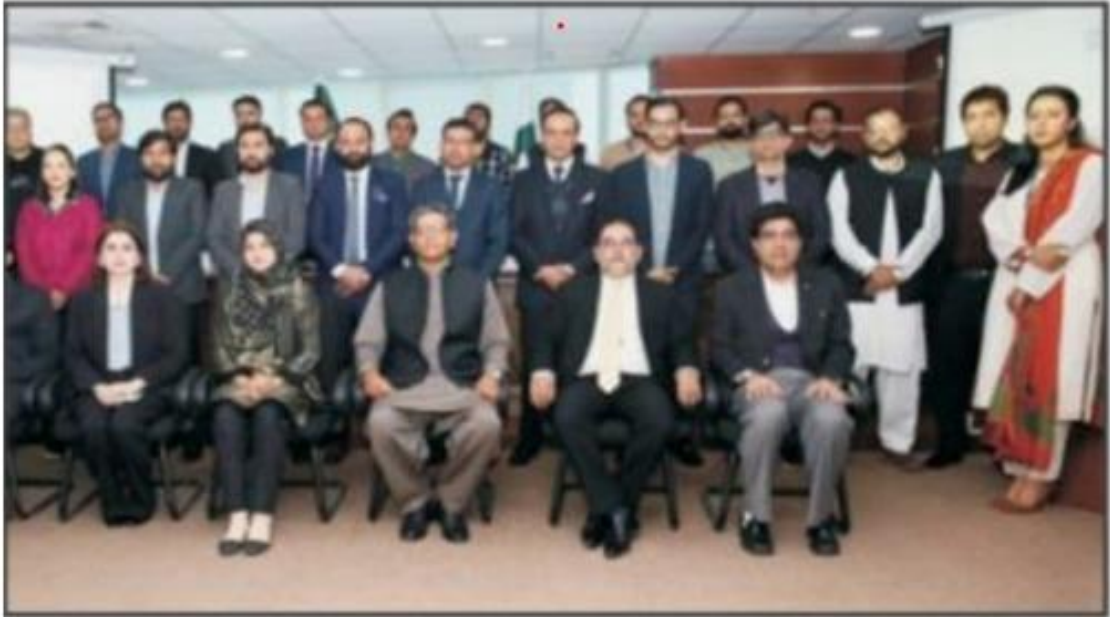
اسلام آباد سی سی پی کے زیر اہتمام منعقدہ سیمینار کے شرکاء کا گروپ فوٹو

کمیشن رشا کارانہ قسبل (کمپلائنس) کے نقطہ نظر کو فروغ دینے کے لئے پرمز ہے مقررین کا سیمینار کے شرکاء سے خطاب اسلام آباد (آئین نیوز) مائیکروفنانس سیکٹر کا کردار اور کاروباری ترقی میں کلیدی کردار ادا کرتا ہے۔ ان نے کیا۔ سیمینار کا انعقاد پاکستان میں کام کرنے والی ملکی معیشت میں مددگار کی بڑی حیثیت رکھتا ہے۔ خیالات کا اظہار کمیشن کمیشن آف پاکستان (سی سی پی) سیکرٹریوں سے وابستہ مائیکروفنانس سیکٹرز کے لیے یہ فرہت کے خاتمے، لوگوں کا معیار زندگی بلند کرنے (پی) کی جانب سے منعقد کئے گئے سیمینار کے شرکاء کیا گیا تھا۔ چونکہ مائیکرو (ہائی ملٹر 7 بجے 52)