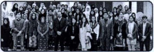
اسلام آباد سی سی پی کی جانب سے قائلہ جناح و دامن یونیورسٹی میں منعقدہ سیمینار کے شرکاء کا گروپ فوٹو