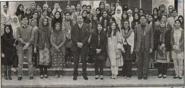
کمپی ٹیشن کمیشن آف پاکستان (سی سی پی) کی جانب سے فاطمہ جناح ویمن یونیورسٹی میں منعقدہ سیمینار کے شرکاء کا گروپ فوٹو

اسلام آباد (دنیا رپورٹ) کمپی ٹیشن کمیشن آف پاکستان نے فاطمہ جناح ویمن یونیورسٹی اسلام آباد میں سیمینار کا انعقاد کیا جس میں شرکاء کو کمپی ٹیشن قانون اور پالیسی سے متعلق آگاہ کیا گیا۔ یہ سیمینار سی سی پی کی جانب سے "کمپی ٹیشن ایڈواکسی اکیڈمی ڈرائیو" کے نام سے شروع کی گئی اس مہم کا حصہ ہے جس کے تحت یونیورسٹیوں کے طلباء اور فیکلٹی ممبران میں کمپی ٹیشن قانون سے متعلق آگاہی پیدا کی جاتی ہے۔