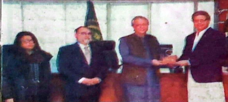
اسلام آباد، وزیر قانون اعظم تارڑ کو دورہ سی سی پی پر چیئرمین ڈاکٹر کبیر احمد شیلڈ دے رہے ہیں

اسلام آباد (نامہ نگار خصوصی) وفاقی وزیر قانون و آف پاکستان) سی سی پی (کے ہیڈ آفس کا دورہ انصاف جناب اعظم تارڑ نے جمعہ کو کمپینیشن کمیشن کیا۔ چیئرمین (ہائی سٹو 6 بقیہ نمبر 6)